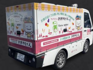
プリンタ、ラッピング、ステッカー ご要望に応じ各種塗装に対応