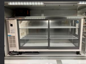
冷蔵ショーケース