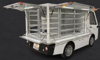
アルミ製の陳列棚(高さ可変式)