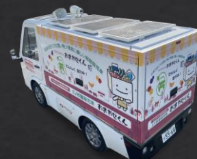
ソーラーパネル発電ユニット