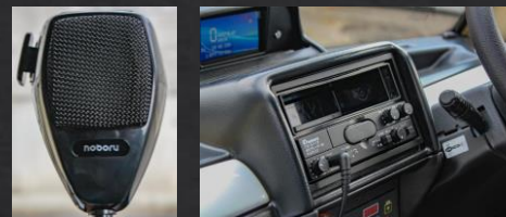
街宣設備(スピーカー、マイク)